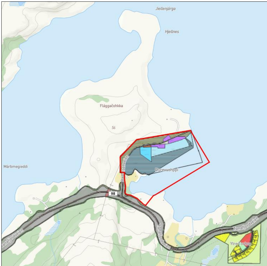
Figur 2 Oversiktskart over hele Torshov. Rød linje markerer nytt planområde for detaljreguleringen.